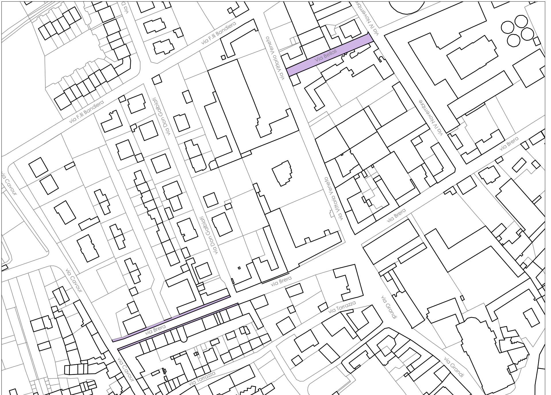
VIA BELLOLI - MARCIAPIEDI IN VIA BRERA